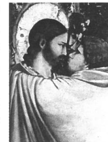
ユダの接吻 ジョット・ディ・ボンドーネ画

編成は、フルート2(2番はピッコロ持ち替え)、オーボエ、コールアングレ、クラリネット2、ファゴット、コントラファゴット、ホルン2、トランペット2、トロンボーン2、打楽器2(ティンパニ、大太鼓、タムタム、シンバル、ヴィブラフォン、シロフォン、マリンバ、チューブラーベル)弦楽5部。