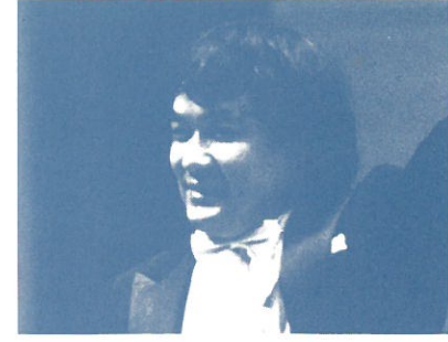
内藤 彰(指揮) Akira Naito

2000年度より定期演奏会を年間5回に増やし、東京第9番目のオーケストラとして今後の活躍が益々期待されている。