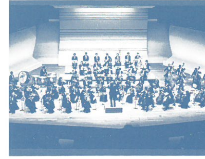
東京ニューシティ管弦楽団 Tokyo New City Orchestra

演奏会評より:洗練されたピアニズムの持ち主、個々の作品を全く違う音色で弾きこなせる魅力。ノ音への特別な感覚と力強くインパクトのある意欲的な表現、ヴィルトゥオジティにあふれる迫力と器の大きさ。ノスケールの大きなショパン、積極的でドラマチックなリスト、とりわけラフマニノフは魅力的で自己のスタイルをしっかり確立させたピアニストとして今後大いに注目したい。